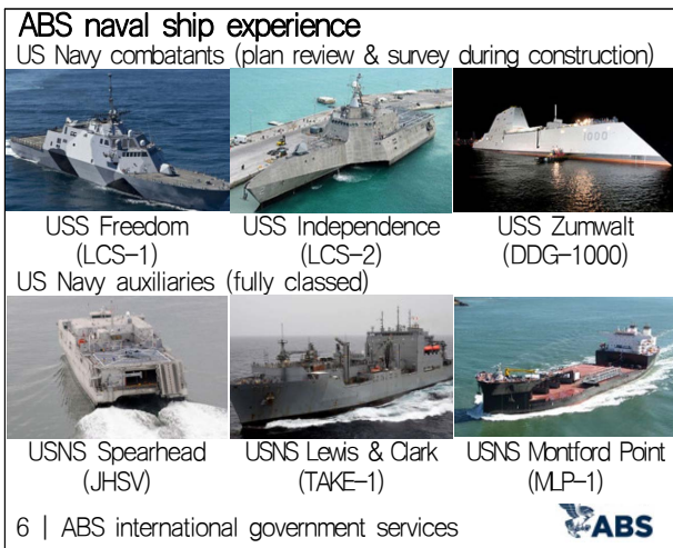
Fig. 1 ABS naval ship experience

미해군의 경우 미 연방법에 따라 해군의 함정, 장비 및 시설에 대한 제작과 건조 및 취부와 수리에 대한 책임과 권한을 해군성 장관(Secretary of the Navy)과 해군 해상체계사령부(Naval Sea Systems Command, NAVSEA)에 부여하고 있다. 그리고 방대한 NAVSEA 조직에서 함정의 건조에 대한 기술검토 및 품질관리 업무는 함정감독관(The Supervisors of Shipbuilding, Conversion and Repair, SUPSHIP)이 담당하고 있다. SUPSHIP은 함정감독관 운영 매뉴얼(SUPSHIP Operations Manual, SOM)을 통해 업무를 상세하게 규정하고 있으며 SOM에는 ABS와의 협력 범위 및 방안 등이 기술되어 있다 (NAVSEA, 2021). 또한 ABS에서는 미 해군 운용함정에 대해서 총수명주기 관리 측면에서 선체, 시스템, 선체강도, 피로강도를 검사/인증하는 총수명주기 평가 프로그램(Service Life Evaluation Program, SLEP)을 제공하는 등 밀접한 해군업무를 수행하고 있다 (ABS, 2017).